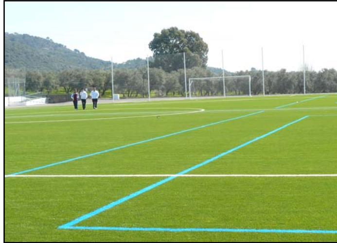
Campo de fútbol nuevo de césped artificial con pistas de atletismo.

conseguido un Taller de Empleo con tres módulos, no?