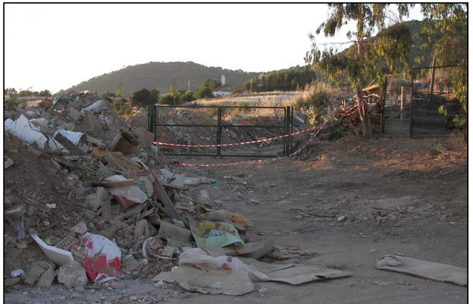
Adiós al vertedero, después de muchos años.